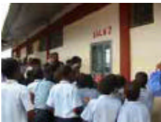
inaugurazione a Machava Aprile 2003

Si sono svolte in questi mesi parecchie attività nell'ambito del Progetto Nafamba Shicolwene, progetto di gemellaggio tra scuole italiane e scuole mozambicane. Con una grande festa è stato inaugurato il 17 Aprile il primo blocco riabilitato della scuola di Machava . Erano presenti le autorità del Ministero dell'Educazione, il direttore dell'Ufficio della Cooperazione italiana, la Rappresentante delle Croce Rossa Mozambicana e della CMC, il coordinatore del Progetto "Um Olhar de Esperança", ma i più allegri erano certamente gli alunni della scuola mozambicana, che hanno festeggiato con canti e danze, e gli studenti del Liceo Democrito di Roma , che hanno voluto essere presenti inviando una lettera di augurio e alcuni disegni e cartoline. Il Democrito ha inviato altri fondi, frutto di una giornata di sensibilizzazione sul Mozambico, che sono stati utilizzati per parte del pagamento dei lavori. A breve verrà iniziata, con gli alunni della scuola di Machava, una attività didattica sul tema dell'acqua, mentre i ragazzi italiani al rientro dalle vacanze potranno iniziare il percorso didattico su questo tema con il materiale preparato nella loro scuola gemellata.